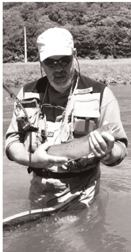
La pêche au streamer est sans conteste la meilleure technique pour débusquer les belles farios de la San.