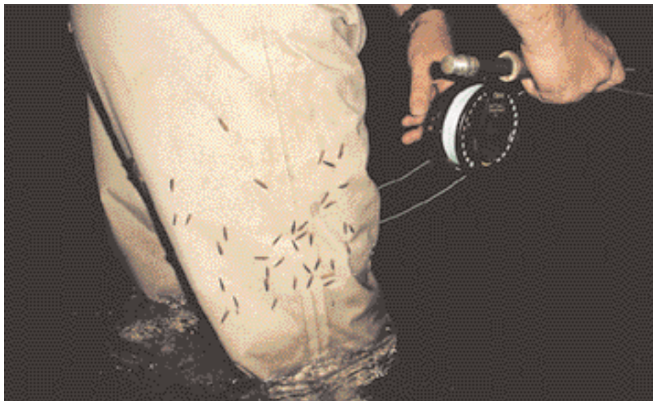
Sedges au coup du soir.