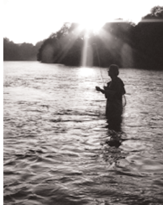
A bientôt la San !

Quel bonheur de se rendre à la pêche plutôt que de prendre le chemin du retour. C'est une sensation inégalable, comme si l'échéance fatale reculait comme par miracle. Pour ce dernier jour de pêche, nous nous sommes rendus au « Tombeau de la Sirène ». Ceux qui s'y rendront un jour – et je vous y invite vraiment – comprendront de suite la raison de cette appellation de légende. L'endroit est féérique : courants violents et profonds, courants simples avec des fosses, gravières à ombres, énorme lisse à courant soutenu et parsemé de nombreuses fosses dont certaines très profondes