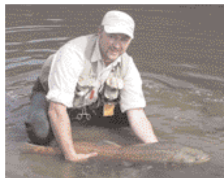
Outre la truite et l'ombre, la San renferme également des huchons.

En septembre, la nuit tombe vraiment très vite et pour ne pas me faire piéger par les « assiettes » au retour, je décide de regagner la berge qui se trouve à quelque 40 mètres. Avec beaucoup de précautions, j'arrive à 7-8 mètres de la berge lorsque mon pied se coince au moment où je veux relever la jambe. Et hop, un deuxième bain, le même jour, un vrai luxe ! A une dizaine de mètres, deux pêcheurs polonais ont observé toute la scène. L'un d'eux ne peut se retenir de rire.